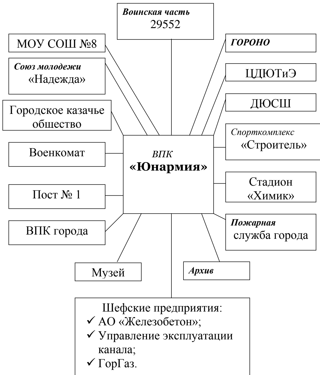
Схема взаимодействия ВПК «Юнармия» с общественными организациями г.Невинномыска