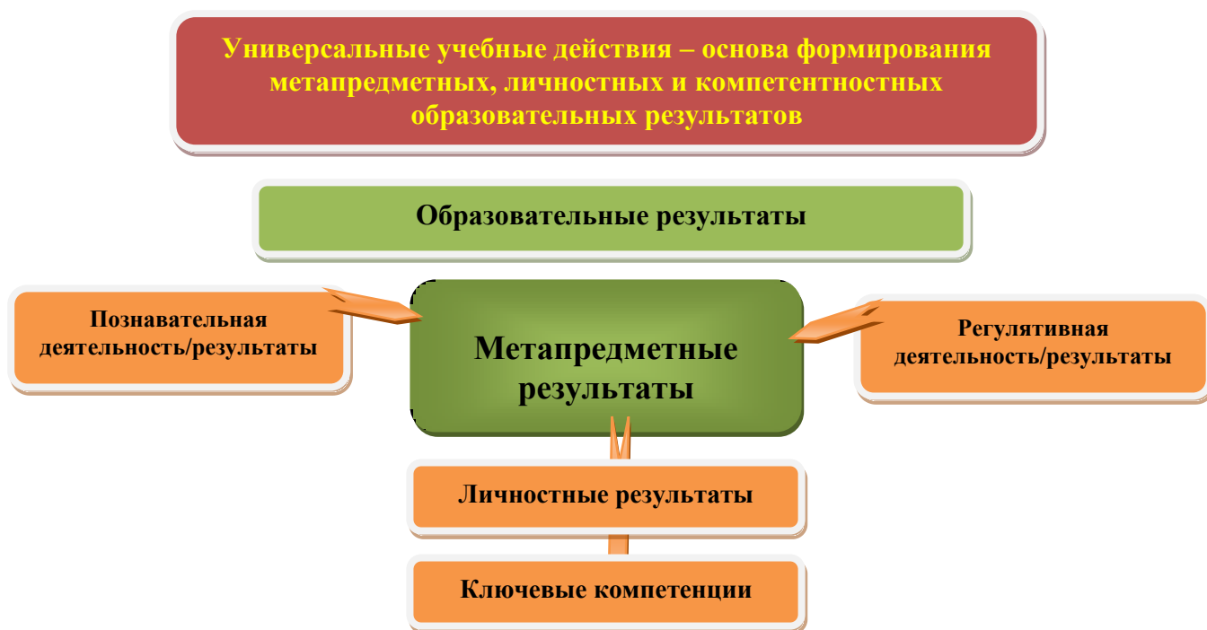
Рис. 3. Система оценки образовательных результатов

Интерпретация результатов оценки ведётся на основе контекстной информации об условиях и особенностях деятельности субъектов образовательного процесса. В частности, итоговая оценка обучающихся определяется с учётом их стартового уровня и динамики образовательных достижений.