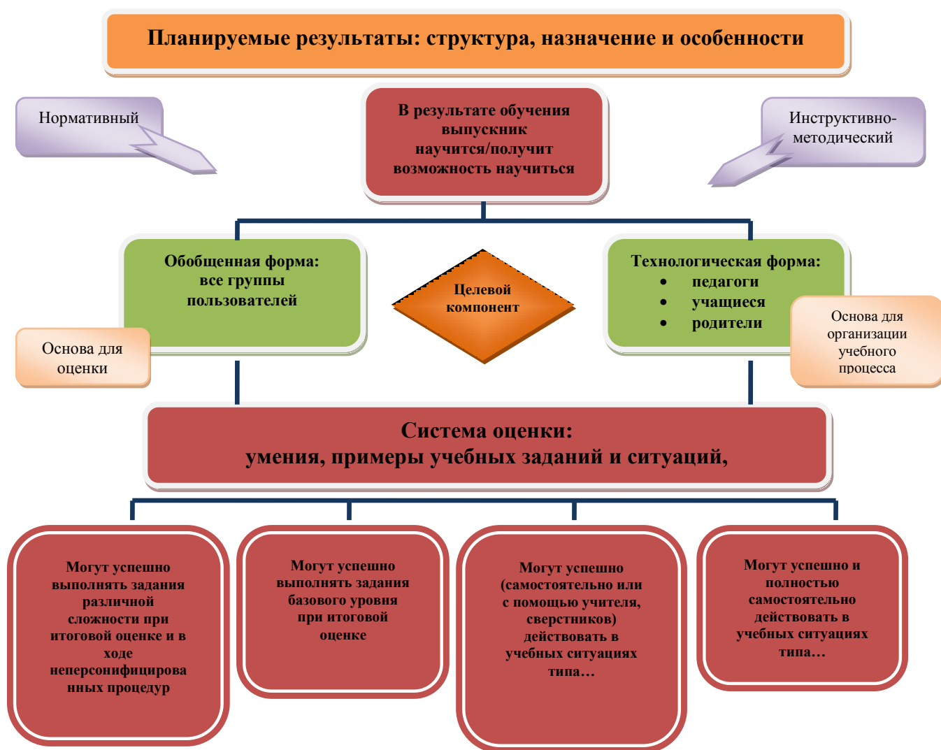
Рис. 1. Особенности структуры планируемых результатов. Функция и назначение.

Система оценки достижения планируемых результатов освоения основной образовательной программы основного общего образования (далее – система оценки) представляет собой один из инструментов реализации требований Стандарта к результатам освоения основной образовательной программы основного общего образования, направленный на обеспечение качества образования, что предполагает вовлечённость в оценочную деятельность как педагогов, так и обучающихся (рис. 1).